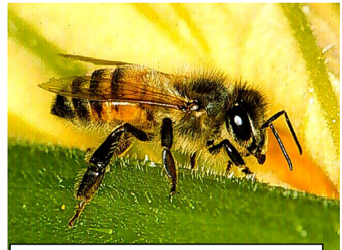
Apis , de honingbij

Bij onoplosbare materialen – bijv. lood - wordt een vijzel en stamper gebruikt om de grondstof tesamen met melksuiker eerst te verwrijven, waarna het tot oertinctuur kan worden verwerkt en gepotentieerd . Uiteindelijk nevelt men de vloeistof over korreltjes, poeders en tabletjes.