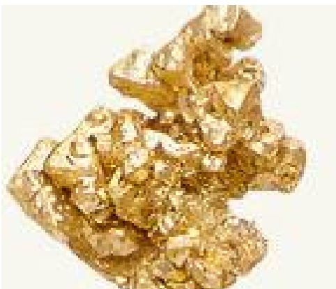
Aurum , of goud

Homeopathie werkt met de energie van stoffen in plaats van met hun scheikundige eigenschappen. Om deze energie vrij te maken wordt de stof “ gepotentieerd ” : dit is het resultaat van herhaald verdunnen en schudden van de oertinctuur, totdat de materiële inhoud van het middel verdwenen is en alleen het energiepatroon overblijft.