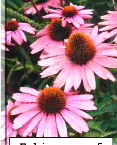
Echinacea of de Rode

Hoe worden homeopatische middelen gemaakt ?